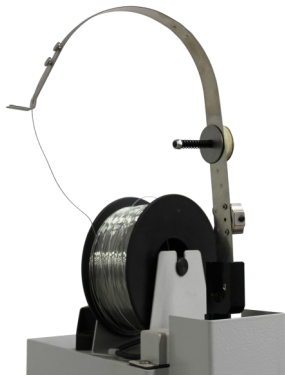
grapa de carrete